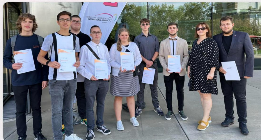
MINULOROČNÍ ABSOLVENTI DofE

V ďalšom čísle sa dozvieme, v akých aktivitách som sa rozvíjala ja a ako som to zvládla.